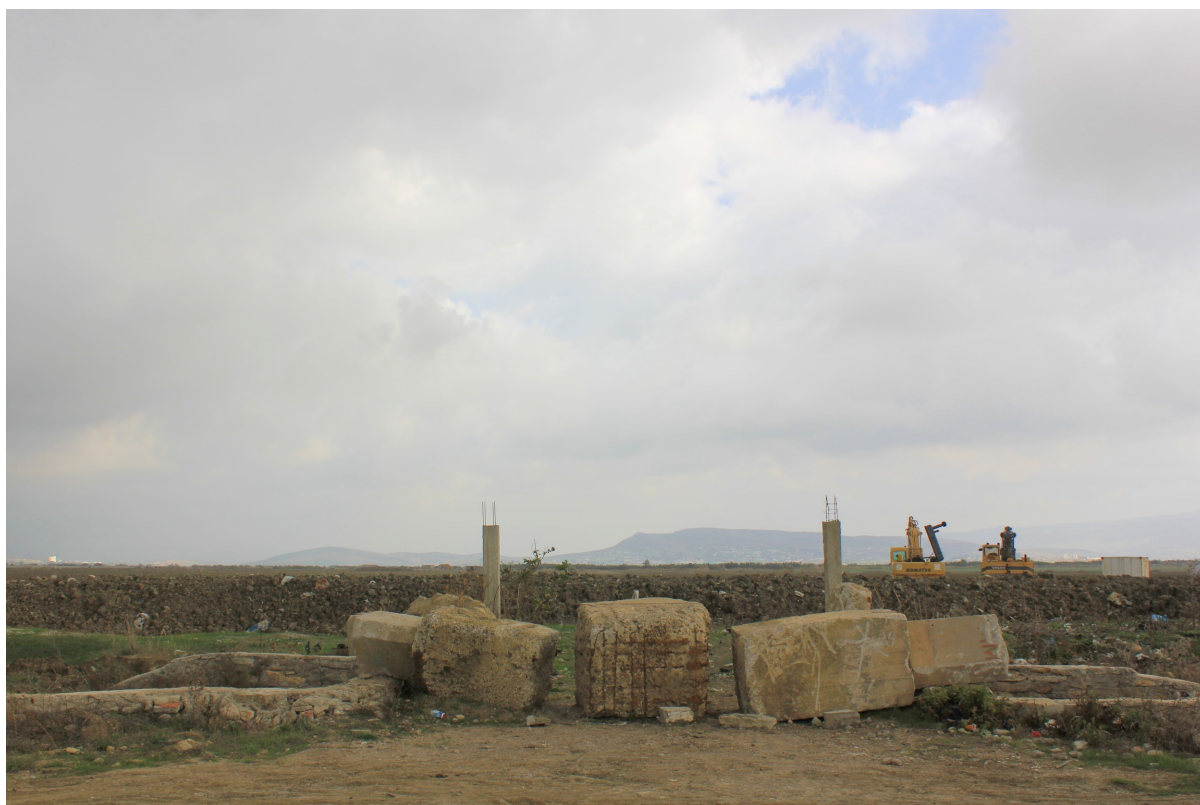
Entre orillas, 2015 Fotografía sobre papel Dimensiones: variables