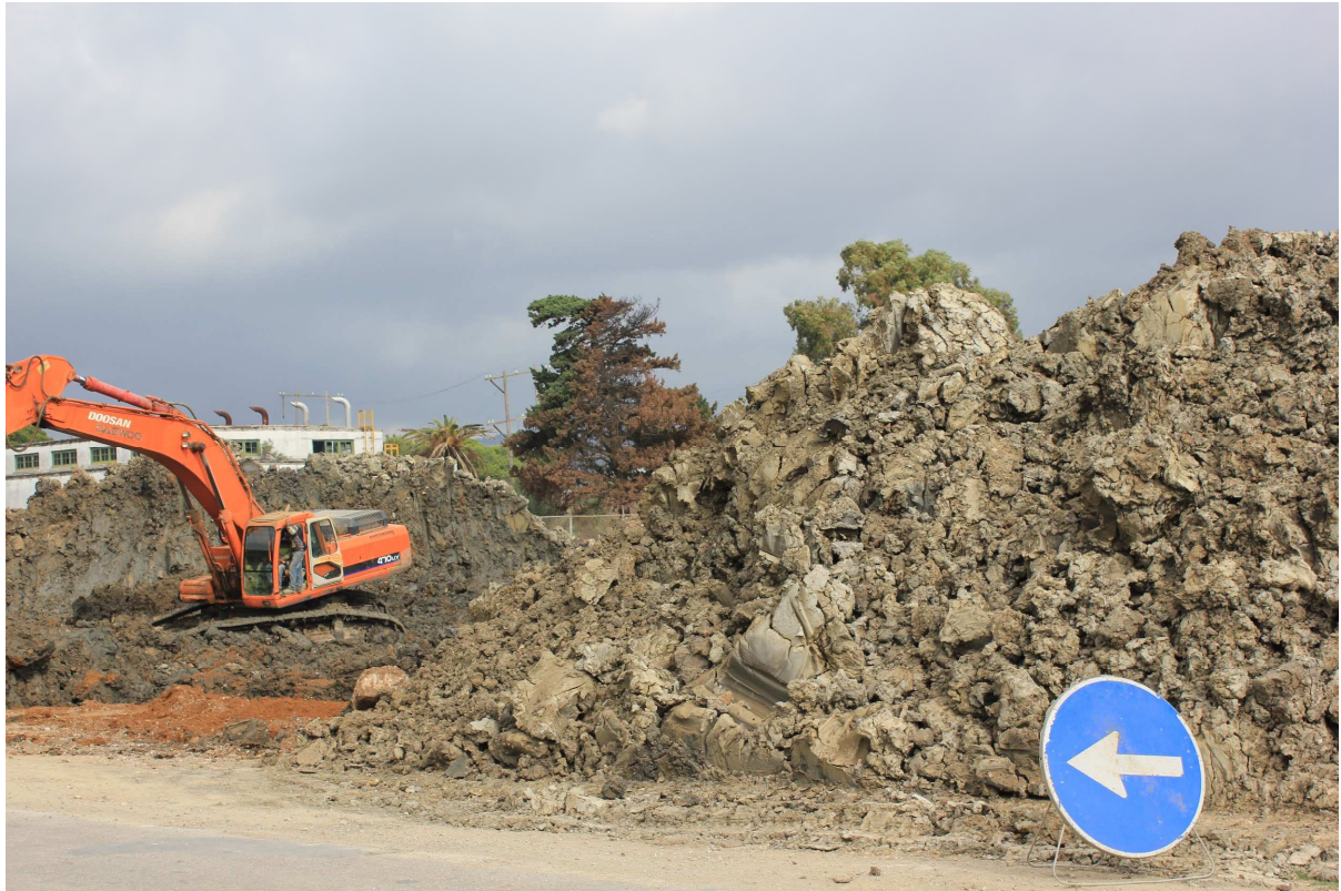
Entre orillas, 2015 Fotografía sobre papel Dimensiones: variables