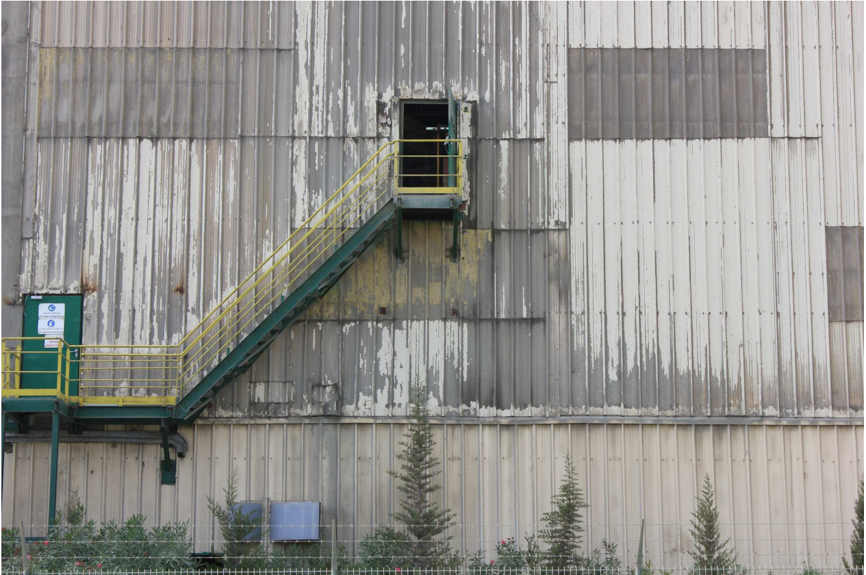
Entre orillas, 2015 Fotografía sobre papel Dimensiones: variables