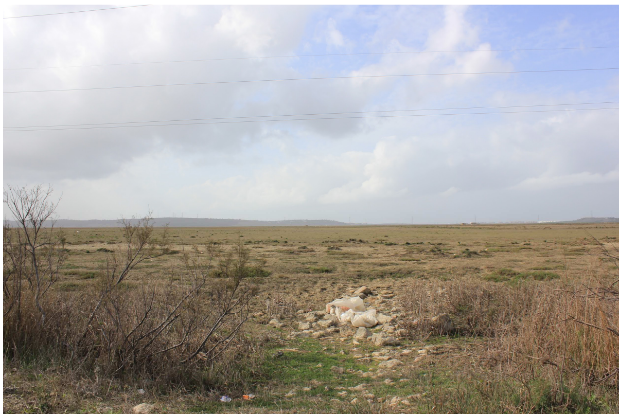
Entre orillas, 2015 Fotografía sobre papel Dimensiones: variables