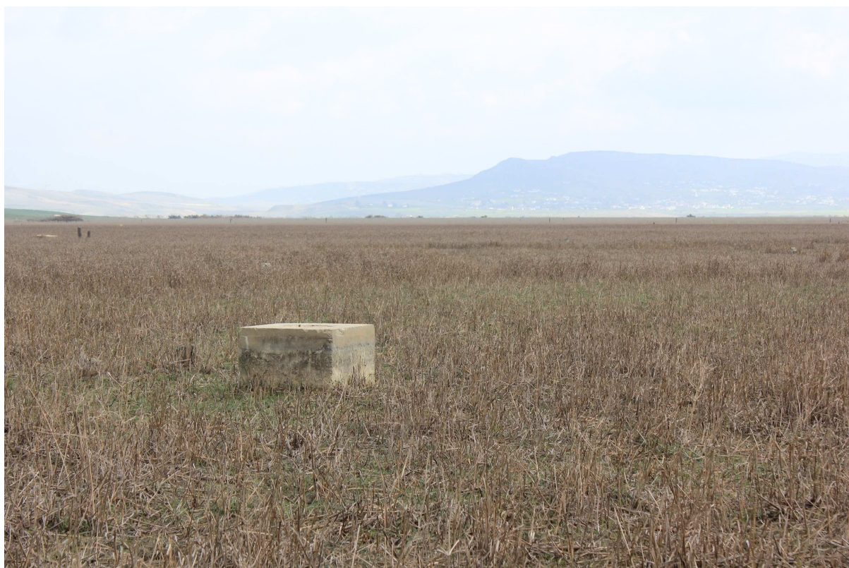
Entre orillas , 2015 Fotografía sobre papel Dimensiones: variables