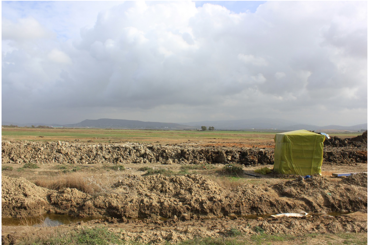
Entre orillas, 2015 Fotografía sobre papel Dimensiones: variables