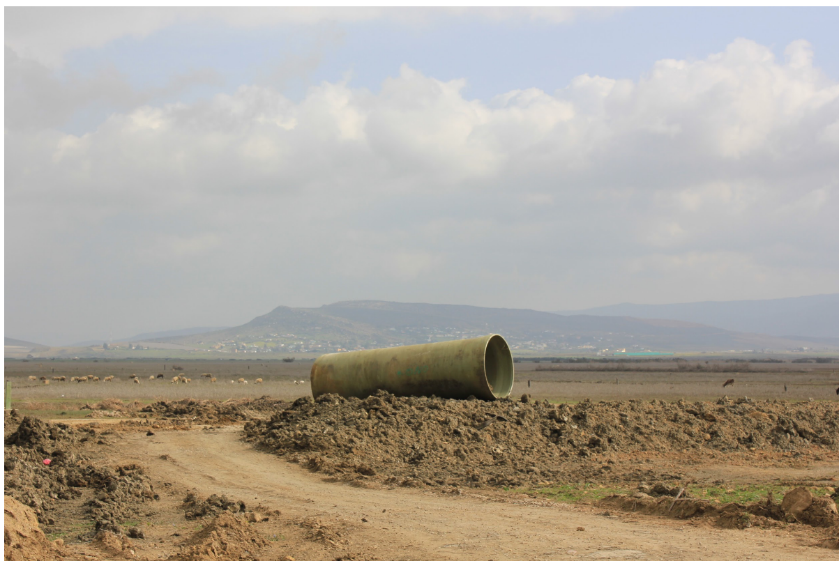
Entre orillas, 2015 Fotografía sobre papel Dimensiones: variables