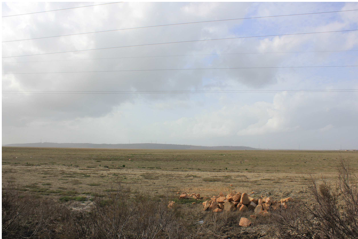
Entre orillas, 2015 Fotografía sobre papel Dimensiones: variables