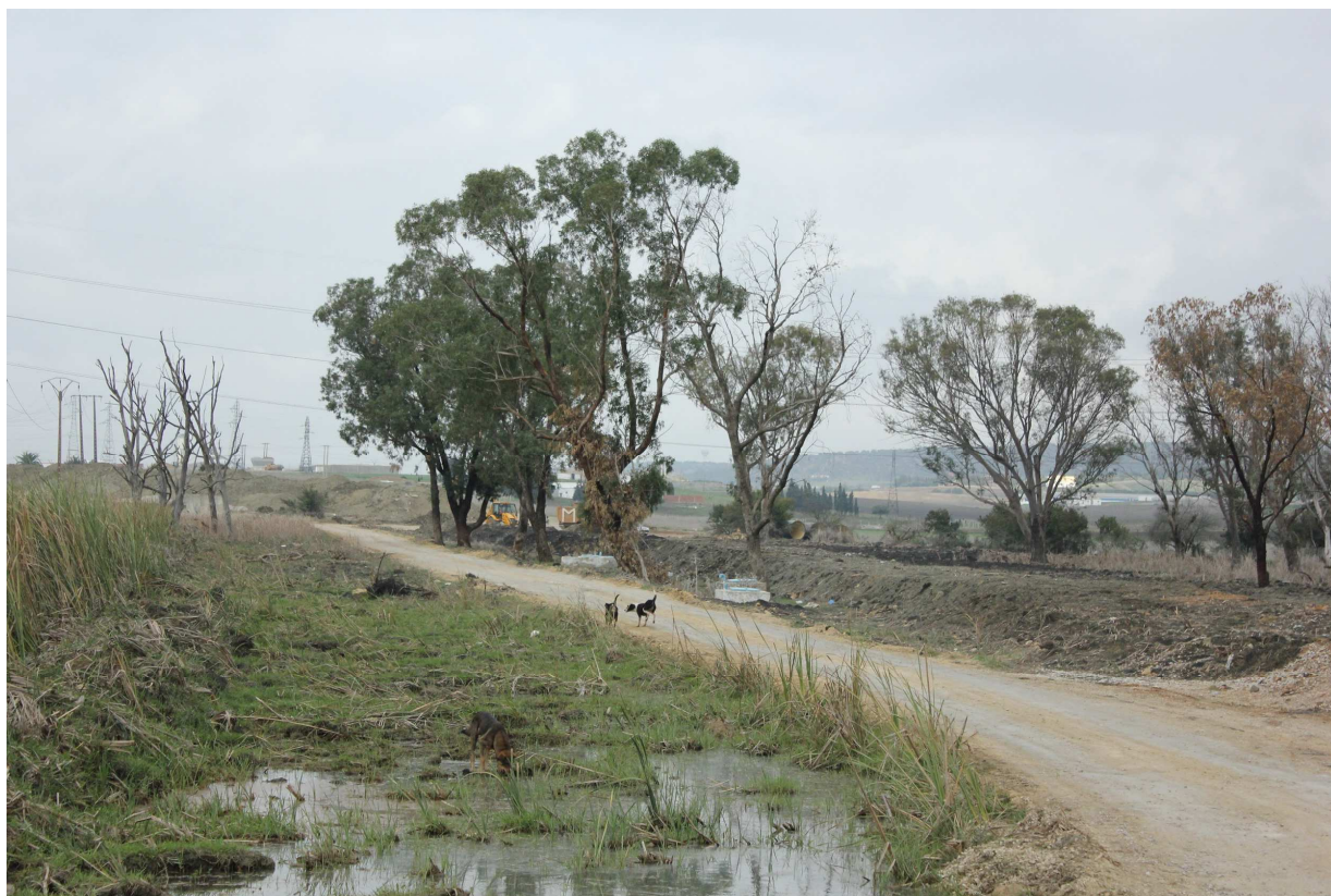
Entre orillas, 2015 Fotografía sobre papel Dimensiones: variables