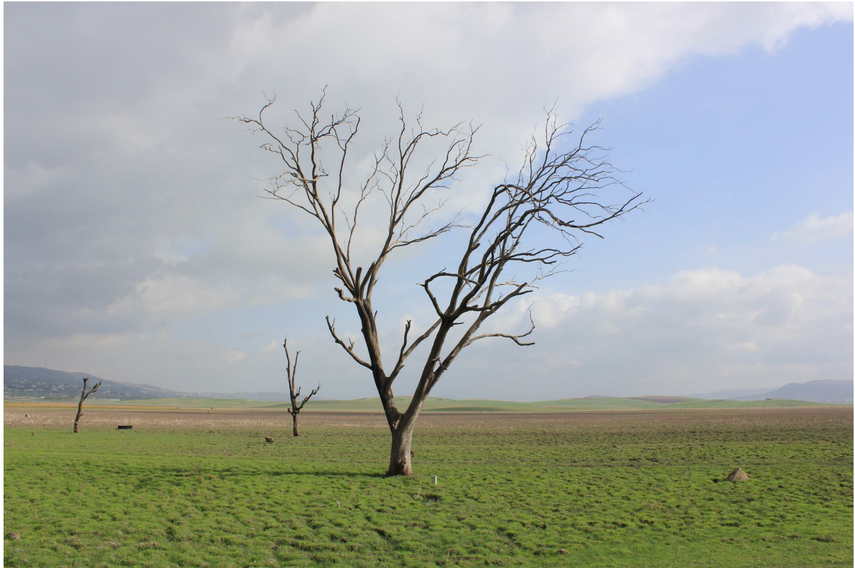
Entre orillas , 2015 Fotografía sobre papel Dimensiones: variables