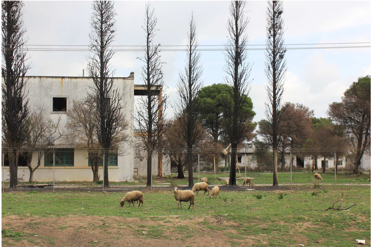
Entre orillas , 2015 Fotografía sobre papel Dimensiones: variables