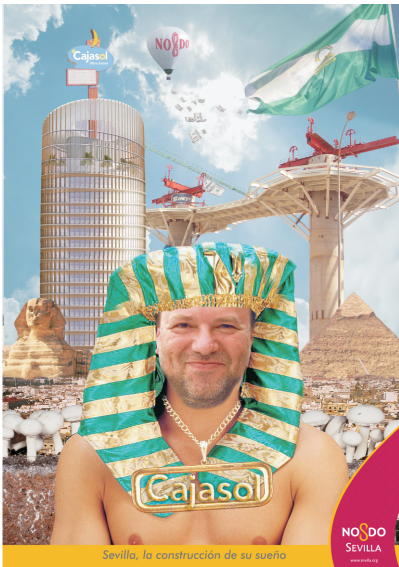
La construcción de su sueño