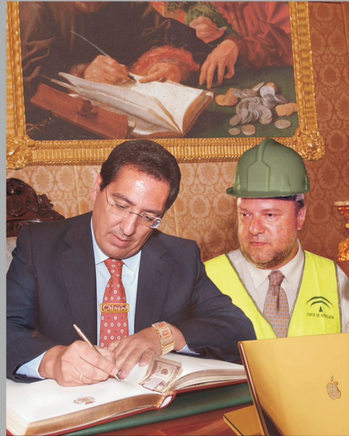
Autor desconocido La firma de la hipoteca 2010s Photographer (Banquero y Alcalde) Musée du Cajasol, Seville

y posiblemente los márgenes serían efectivamente usura. Pero otras instituciones hacían lo mismo como el Monte de Piedad, y no entraba en sus fines primigenios eso. Y además la usura era un "pecado" para la Iglesia. El dinero, en realidad, era un número de poca monta, un vendible a plazos simplemente, al cual muchas veces le dejaban de pagar y se las veía negras para cobrar la deuda. Aunque por otro lado, muchos han hecho grandes fortunas con ese método.