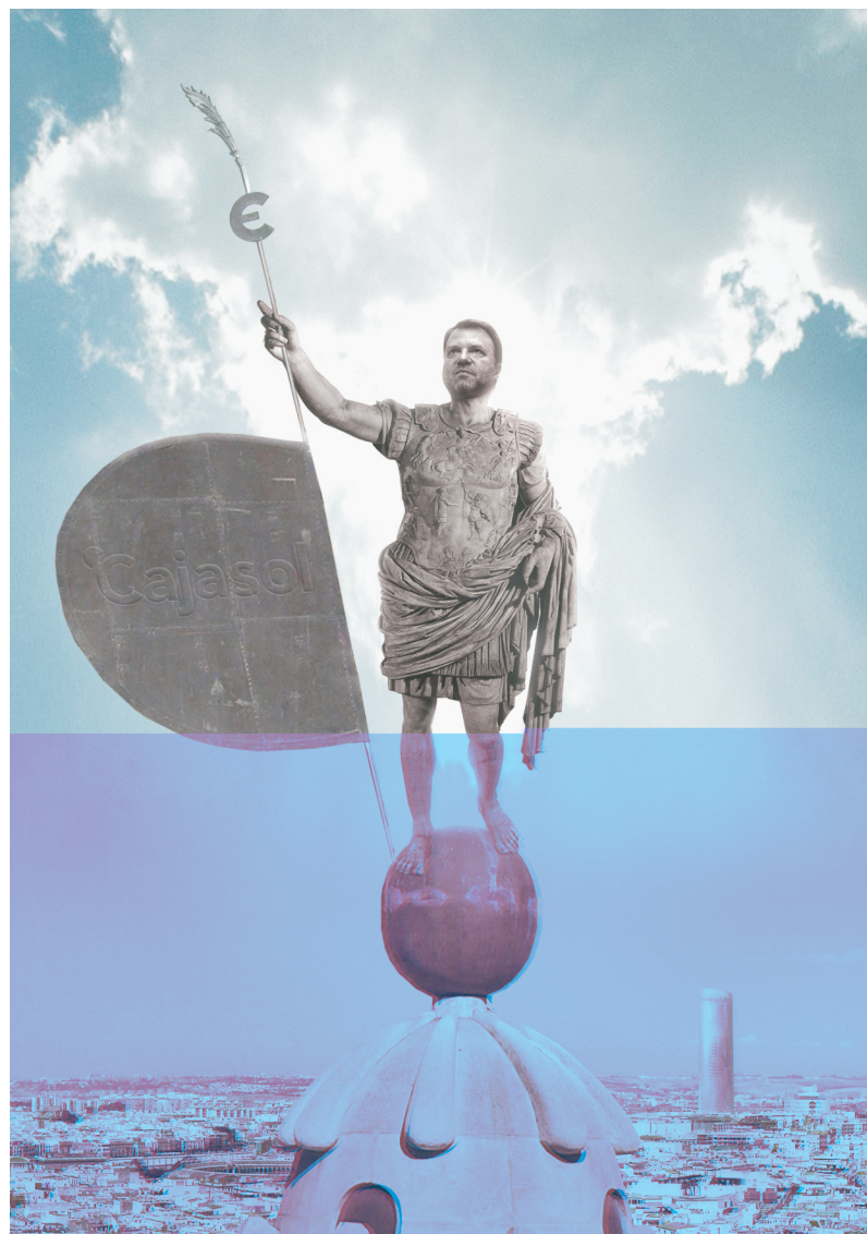
El nuevo giraldillo