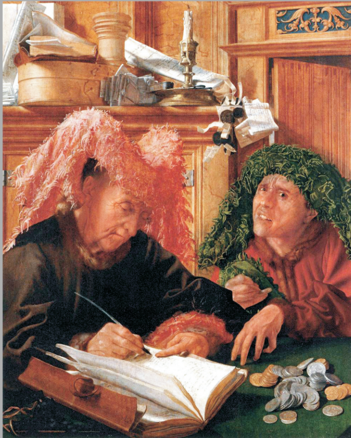
REYMERSWAELE, Marinus van The Tax Collectors 1540s Oil on panel, 94 x 77 cm Musée du Louvre, Paris

DITERO. Dinero era esa persona que venía a plazos y cobraba semanal o mensualmente una modesta cantidad hasta saldar la deuda. El I.A.E. dice de la Dena. Deuda (obligación de pagar). Y en Andalucía, pago a plazos, en pequeñas cantidades, fijadas por el consumidor o por el cliente, y en ocasiones, con incremento del interés sin el consentimiento de este. Le hablaban a esta gente con el mismo respeto que se le podría hablar a un director de banco, y en el fondo solo eran usuarios que se servían de la necesidad de los demás para ganar dinero, y posiblemente los márgenes serían efectivamente usura. Pero