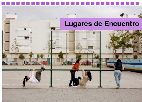
Lugares de Encuentro